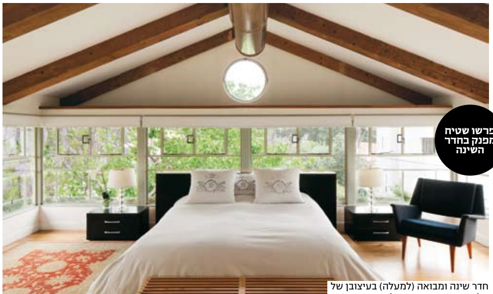
פרשו שטיח מפנק בחדר השינה