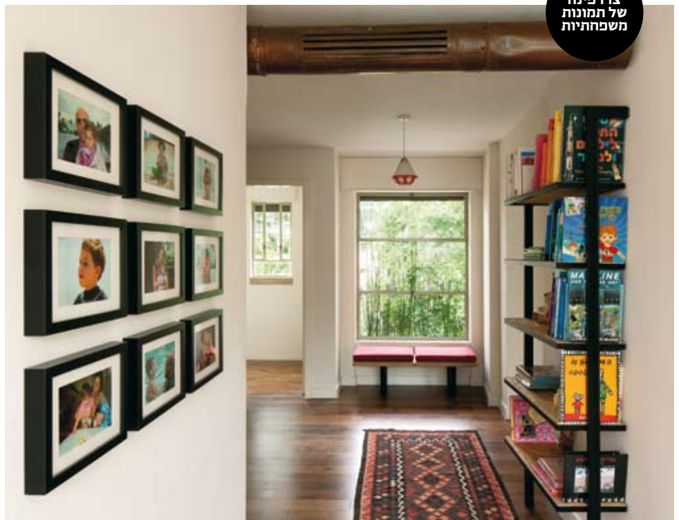
צרו פינה של תמונות משפחתיות