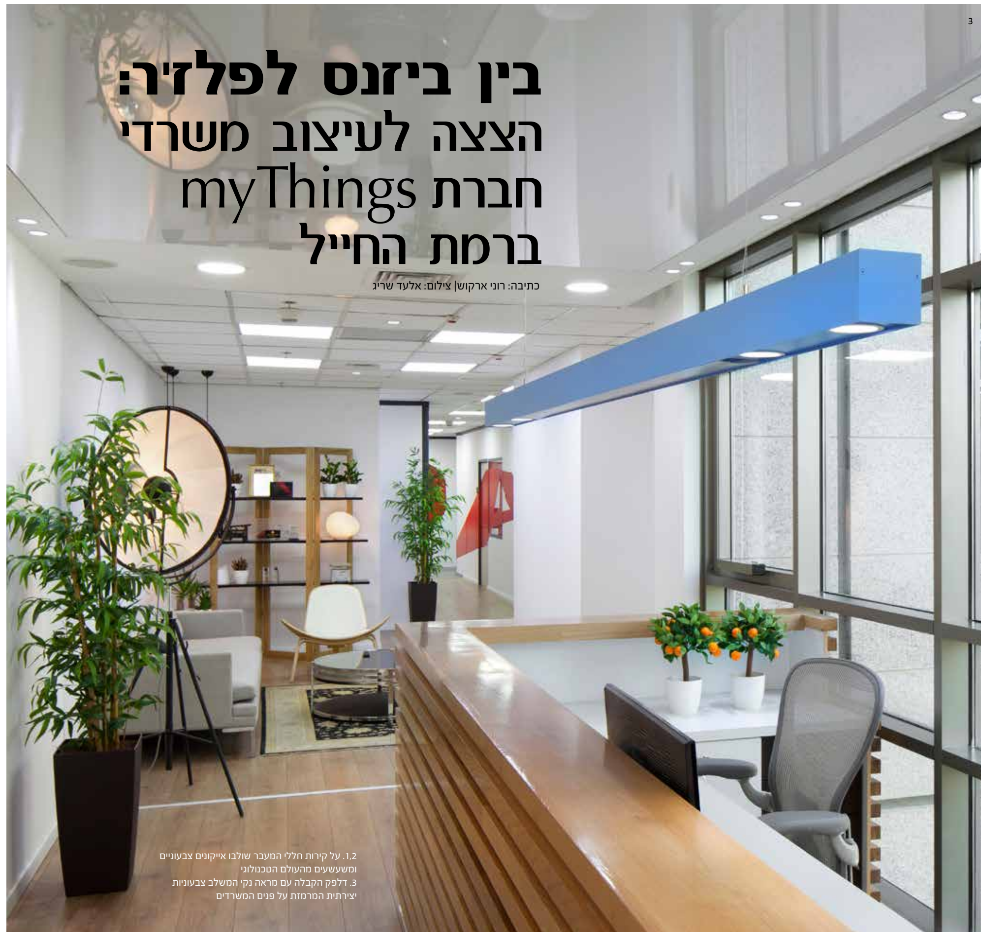
1,2. על קירות חללי המעבר שולבו אייקונים צבעוניים ומשעשעים מהעולם הטכנולוגי. 3. דלפק הקבלה עם מראה נקי המשלב צבעוניות יצירתית המרמזת על פנים המשרדים.