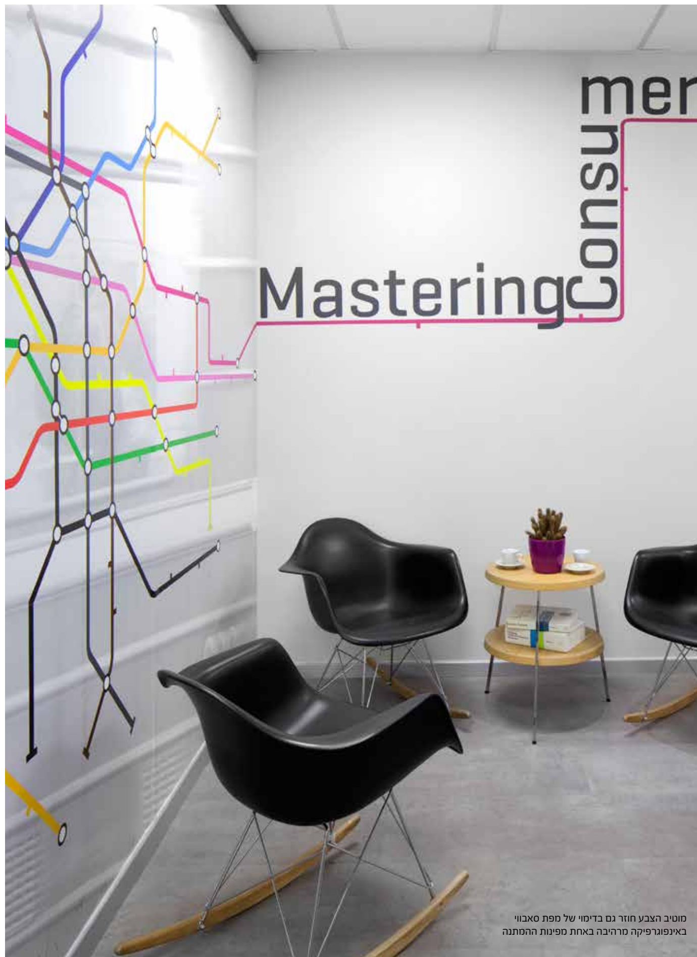
מוטיב הצבע חוזר גם בדימוי של מפת סאבווי באינפוגרפיקה מרהיבה באחת מפינות ההמתנה