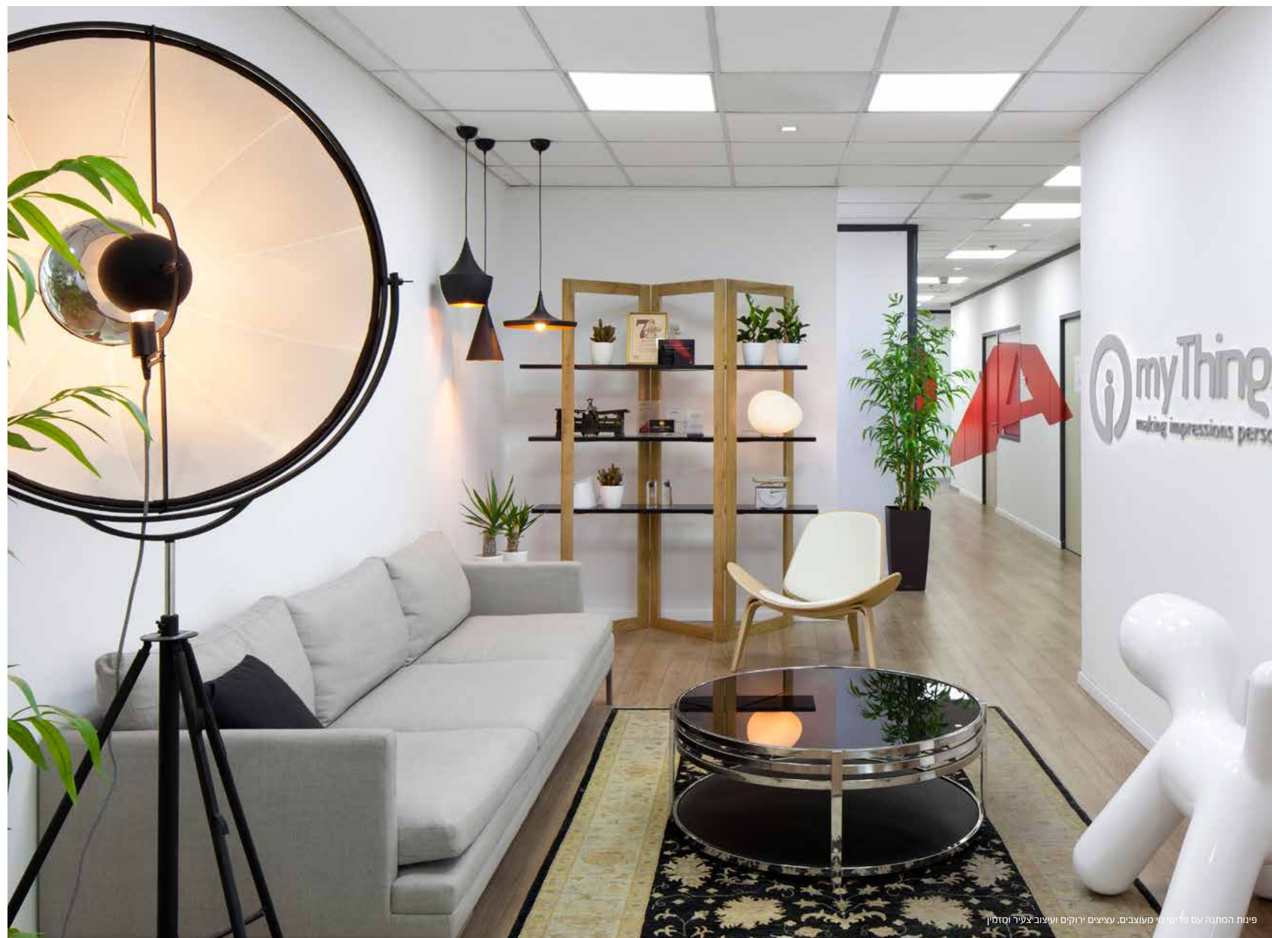
פינות המתנה עם פריטי מי מעוצבים, עציצים ירוקים ועיצוב צעיר ומזמין

אחת המטרות העיקריות אשר הוגדרו לפרויקט היו לרענן את תדמית המותג של החברה, אשר נעה על התפר בין עולם ההיי טק לעולם הפרסום. בין הצרכים הרבים שעלו היה הרצון לתת מענה חזק יותר למורשת הטכנולוגית המרשימה של החברה, זאת לצד יצירת סביבה צעירה, עכשווית ונעימה עבור עובדיה