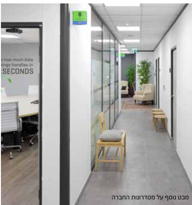
מבט נוסף על מסדרונות החברה

אחת המטרות העיקריות שהוגדרו לעיצוב הפרויקט הייתה, ריענון תדמית המותג של החברה, אשר נעה על התפר שבין עולם ההיי-טק, לעולם הפרסום. בין הצרכים הרבים שעלו, היה הרצון לתת מענה מודגש למורשת הטכנולוגית המרשימה של החברה, לצד יצירת סביבה צעירה ועכשווית הנעימה לעבודה. דגש נוסף הושם בתכנון חלוקת החלל וביצירת אווירה חברתית וחובקת לעובדים, אשר תמטב את עירנותם ותפקודם. החללים הציבוריים, קיבלו מתיחת פנים נרחבת על ידי החלפת חיפויים ברצפות ובתקרות, שיבוץ מחדש של גופי תאורה, זריקת צבע משמעותית ברחבי החלל ומיתוג מחדש של פני המשרד.